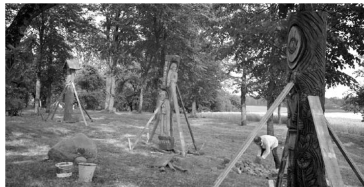
Tvirtai įbetonuotos, tinkamai sumontuotos, patikimai sutvirtintos trys skulptūros Malaišiuose netrukus sulauks ir garsiųjų „Vaižgantinių“.