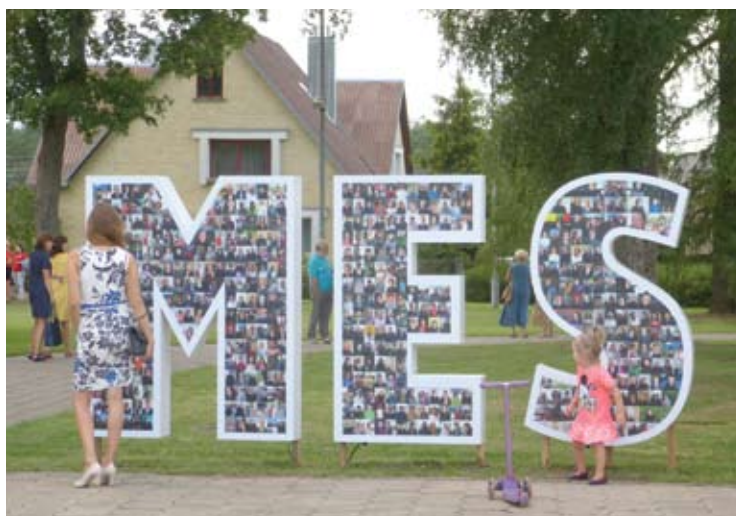
Anykštėnų fotoportretų kaliažas „MES“.