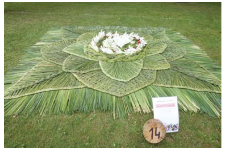
Floristinių kilimų konkurso B kategorijoje nugalėjo Maduonos (Latvija) komandos darbas.