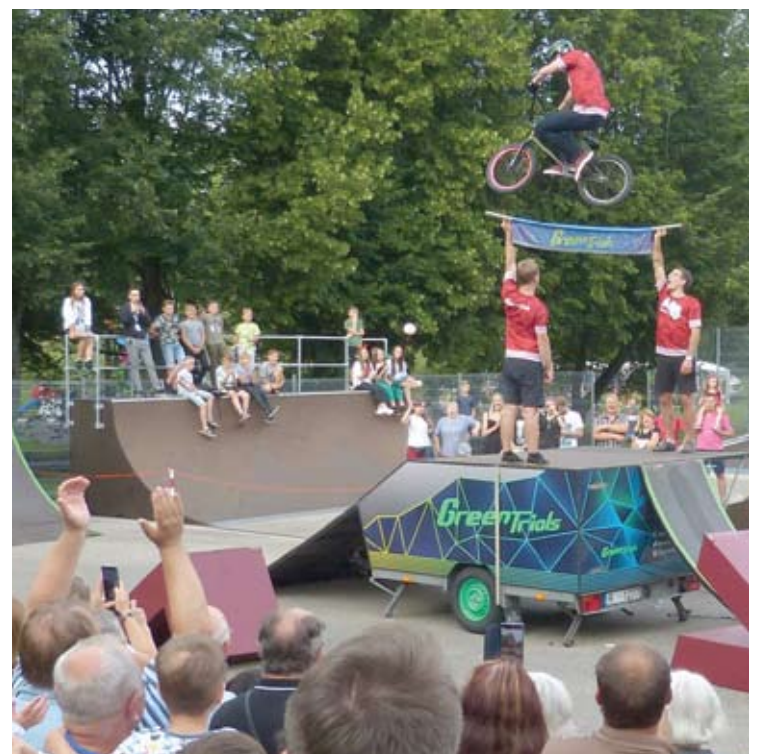
Miesto parke pasirodė dviračių akrobatai iš Latvijos - „Green Trials“.