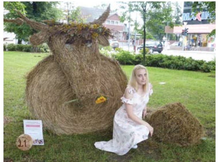
C kategorijoje nugalėjo pripažinta Traupio komandos kompozicija.