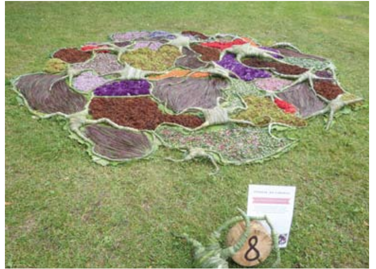
A kategorijoje geriausiu kilimu pripažintas Minsko (Baltarusija) floristų darbas „Katalonijos dangus“.

Vakariniame šeštadienio koncerte pasirodė keturios grupės, tarp jų ir legendinės „Poliarizuoti stiklai“ ir „Rojaus tūzai“.