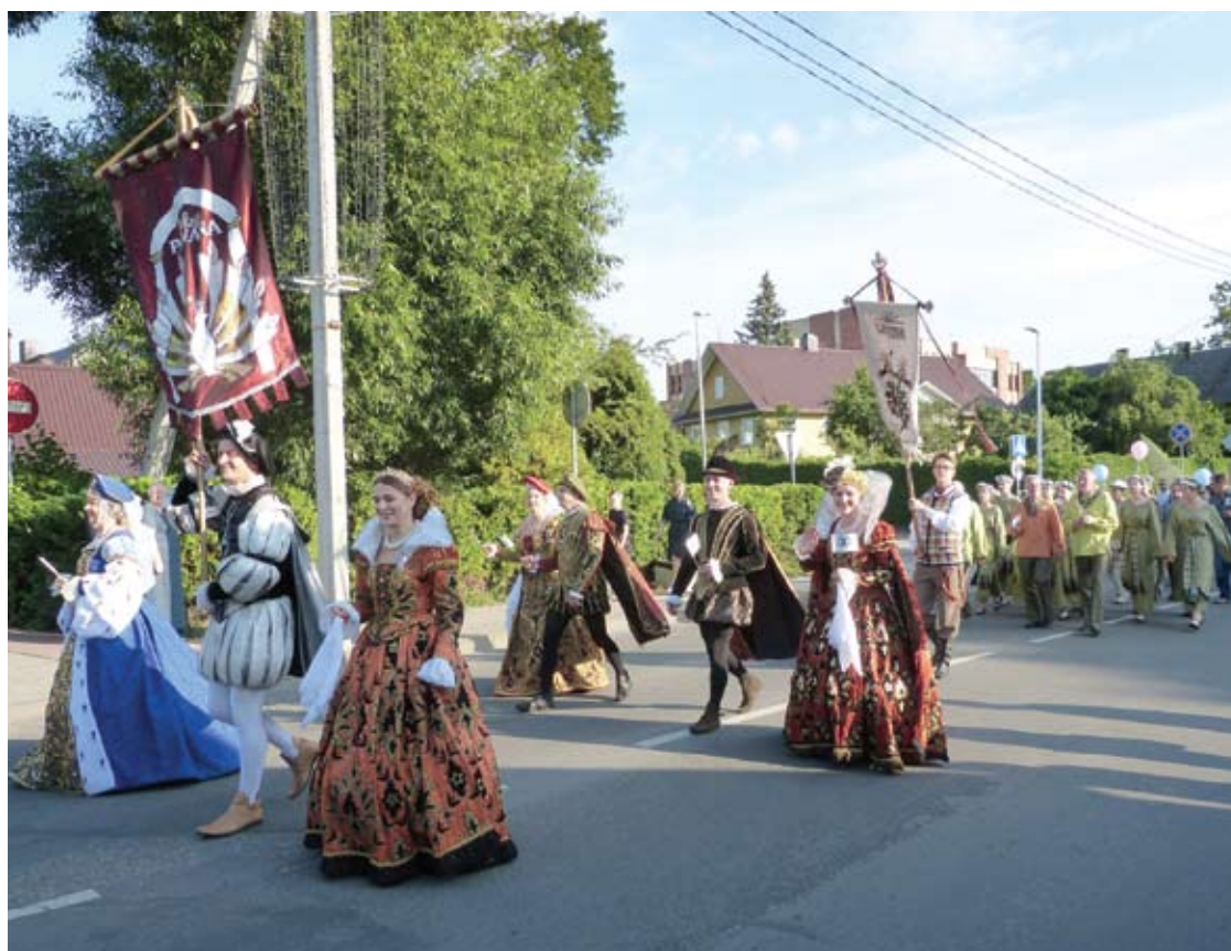
Anykščių miesto šventė prasidėjo eitynėmis nuo Koplyčios iki miesto parko.

Vidmantas ŠMIGELSKAS Simona STRAŽINSKAITĖ